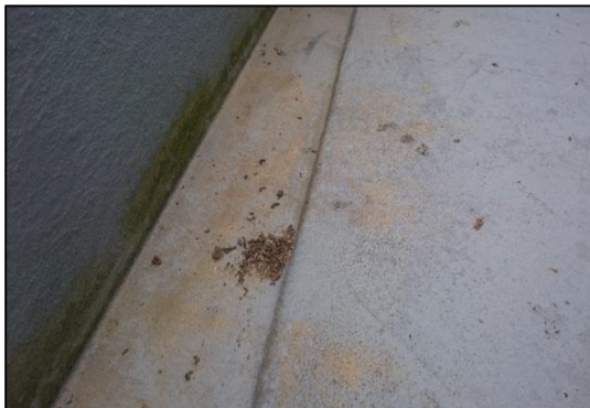
被害を被ったベランダ

そして、それだけの数の鳩の糞が雨樋に溜まり、雨樋が機能しなくなり、酷いところでは糞が土化して草が生えてくるところもあります。